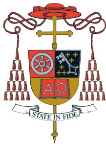
Karl Kardinal Lehmann Bischof von Mainz